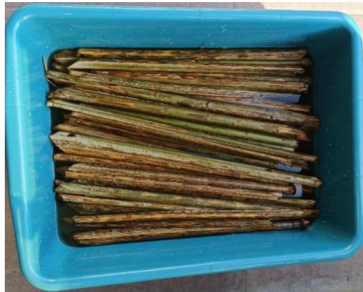
Gambar 5. Perendaman dengan Larutan alkali

Potongan pelepah salak kemudian dilakukan perendaman dengan larutan NaOH 5%. Fungsi dilarutkan dengan larutan alkali yaitu untuk menghilangkan lignin dan hemiselulosa untuk meningkatkan kandungan selulosa, di mana tujuan proses ini adalah memisahkan lignin dengan pengotor sehingga di dapatkan serat lebih yang lebih bersih dari zat pengotor. NaOH dipilih karena sifatnya kelarutannya dalam air yang relatif mudah dan dapat mengalami proses ionisasi secara sempurna karena merupakan basa kuat. Pertimbangan lain menggunakan larutan ini salah satunya terkait harganya yang relatif murah dibandingkan larutan basa sejenis. Proses perendaman dilakukan dengan larutan NaOH 5% yang dilakukan selama 4 jam. Proses kemudian dilanjutkan dengan pembilasan dengan aquades untuk meminimalisir sisa-sisa pengotor.