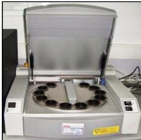
Gambar 3. Philips PANalytical Minipal 4 XRF [12]

Serat dilakukan karakterisasi pengujian XRF ( X-Ray Fluorescence ) untuk mengetahui kandungan senyawa dan unsur dalam serat pelepah salak. XRF adalah metode analisis non-destruktif untuk menentukan komposisi unsur pada suatu material atau sampel.