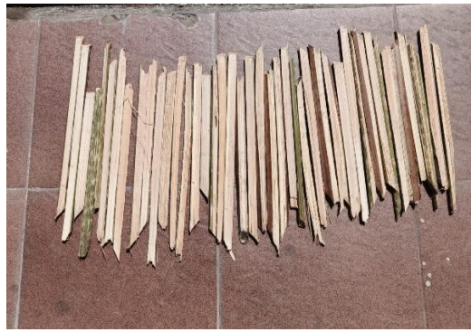
Gambar 4. Potongan Pelepah Salak Bojonegoro

Potongan pelepah salak kemudian dilakukan perendaman dengan larutan NaOH 5%. Fungsi dilarutkan dengan larutan alkali yaitu untuk menghilangkan lignin dan hemiselulosa untuk meningkatkan kandungan selulosa, di mana tujuan proses ini adalah memisahkan lignin dengan pengotor sehingga di dapatkan serat lebih yang lebih bersih dari zat pengotor. NaOH dipilih karena sifatnya kelarutannya dalam air yang relatif mudah dan dapat mengalami proses ionisasi secara sempurna karena merupakan basa kuat. Pertimbangan lain menggunakan larutan ini salah satunya terkait harganya yang relatif murah dibandingkan larutan basa sejenis. Proses perendaman dilakukan dengan larutan NaOH 5% yang dilakukan selama 4 jam. Proses kemudian dilanjutkan dengan pembilasan dengan aquades untuk meminimalisir sisa-sisa pengotor.