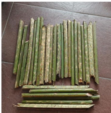
Gambar 2. Pelepah Salak

Pelepah salak yang telah diperoleh dari kabupaten Bojonegoro kemudian dipotong sepanjang 20 cm agar mempermudah proses pengambilan serat. Pelepah salak yang digunakan sebaiknya tidak berukuran terlalu besar karena akan menyulitkan dalam proses pengambilan seratnya, juga tidak berukuran terlalu kecil karena serat yang dihasilkan sedikit. Perlakuan alkali diberikan dengan menggunakan larutan NaOH 5 %. Larutan ini didapatkan dari dengan melarutkan serbuk NaOH dengan larutan aquades. Pelepah salak dihancurkan dengan palu atau benda keras agar mempermudah dalam pengambilan serat. Serat diambil dengan menyisir dengan menggunakan sikat besi. Serat yang didapatkan kemudian dikeringkan kurang lebih selama 3 (tiga) hari atau sampai serat kering. Serat dipotong sesuai dengan kebutuhan untuk pengujian dan kemudahan dalam melakukan pengambilan seratnya. Sampel yang ditandai untuk pengujian XRF (A) dan sampel untuk pengujian lignoselulosa dengan metode Chesson - Datta (B).