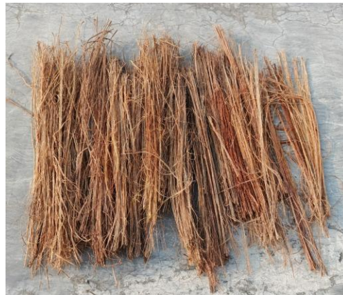
Gambar 6. Serat setelah proses pengeringan

Pengambilan serat pelepah salak dilakukan dengan menghancurkan pelepah salak yang telah dilakukan proses perendaman dengan larutan alkali. Serat pelepah salak kemudian diambil dengan menggunakan sikat besi. Serat pelepah salak kemudian dikeringkan sampai serat kering di bawah sinar matahari. Serat yang telah kering ditampilkan seperti pada Gambar 6 berikut ini,