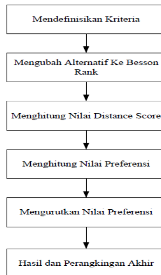
Gambar 1. Kerangka Kerja Metode Oreste

Dari kerangka kerja yang telah disusun dapat dijadikan petunjuk dalam penerapan Metode Oreste untuk menentukan Pestisida Terbaik Terhadap Hama Padi Desa Kolam Kecamatan Percut Sei Tuan. Tahapan-tahapan dari Metode Oreste yang telah disusun dalam gambar di atas yaitu kerangka kerja Metode Oreste sebagai berikut: