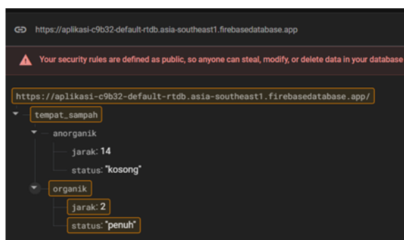
Gambar 6. Tampilan Realtime Database Pada Firebase