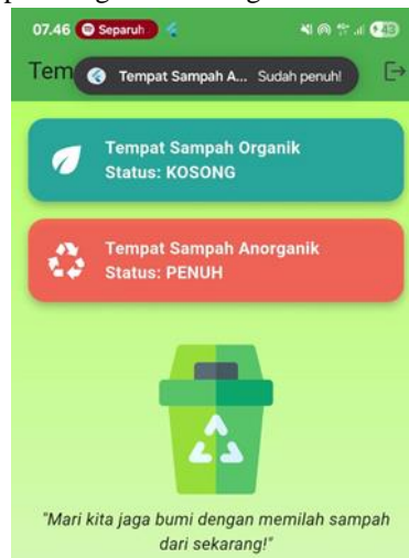
Gambar 8. Tampilan Notifikasi Aplikasi Android

Ketika status tempat sampah berubah, misalnya dari "kosong" menjadi "penuh", aplikasi akan secara otomatis memperbarui tampilan informasi di halaman utama. Selain itu, sistem juga mengirimkan notifikasi lokal kepada pengguna sebagai peringatan bahwa tempat sampah perlu segera dikosongkan.