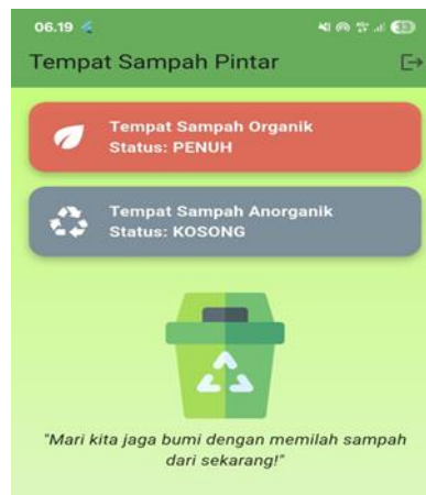
Gambar 7. Tampilan Notifikasi Aplikasi Android