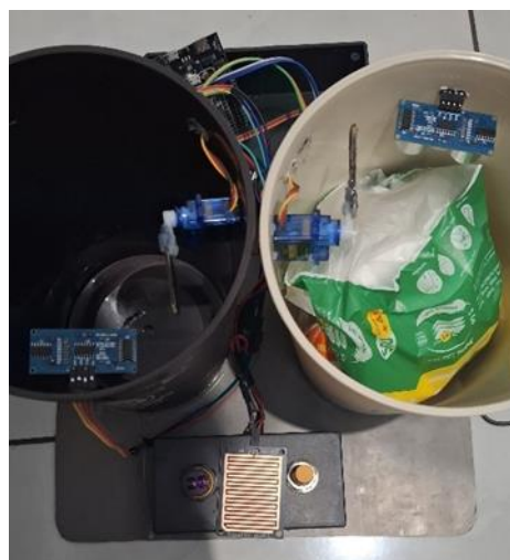
Gambar 5. Sensor Ultrasonik

Pengujian dilakukan dengan menambahkan sampah secara bertahap ke dalam tempat sampah. Ketika jarak antara sensor dan permukaan sampah mencapai ambang batas yang ditentukan (sekitar 5 cm), sistem akan memperbarui status di Firebase menjadi "penuh". Status ini kemudian ditampilkan secara real-time di aplikasi Android dan notifikasi otomatis akan muncul pada layar pengguna.