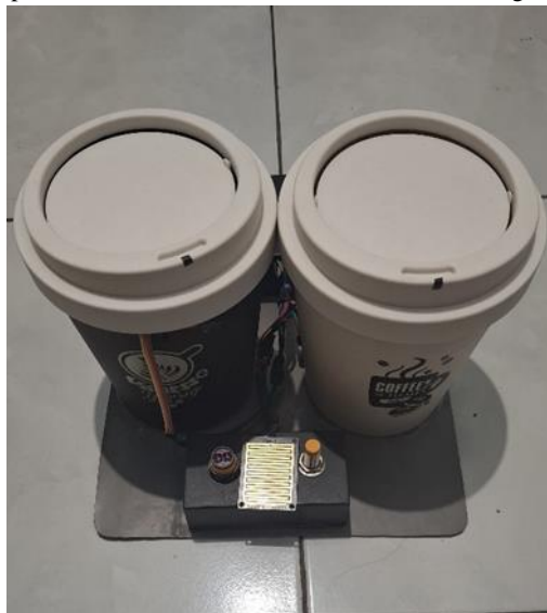
Gambar 2. Tampilan Depan Alat

Hasil implementasi perangkat ini menampilkan bentuk alat secara keseluruhan dari berbagai sudut.