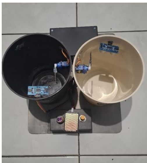
Gambar 3. Tampilan Sensor Ultrasonik dan Servo

Gambar 2 diatas adalah gambar tempat sampah tampak depan, Sensor ultrasonik HC-SR04 dan servo terdapat di dalam tutup tempat sampah.