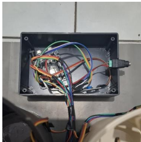
Gambar 4. Tampilan ESP32 Pada Bagian Belakang

Gambar 4. diatas merupakan tampilan ESP32 dan soket untuk adaptor sebagai sumber daya buat berjalannya tempat sampah otomatis.