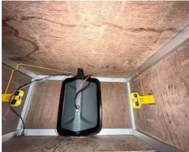
Gambar 3. Pengujian Sensor Ultrasonik HC-SR04

Gambar ini menunjukkan tampilan bagian dalam dari prototipe sistem Smart Rubbish yang dikembangkan. Terlihat dua buah sensor ultrasonik HC- SR04 yang dipasang menghadap ke atas pada sisi kiri dan kanan, masing- masing ditujukan untuk mendeteksi ketinggian sampah organik dan nonorganik. Di tengah terdapat wadah penampung yang dapat berputar atau bergeser dikendalikan oleh motor servo, yang menerima perintah dari mikrokontroler berdasarkan hasil deteksi jenis sampah. Sensor ultrasonik ini bekerja dengan mengukur jarak antara permukaan sampah dengan sensor untuk menentukan status penuh atau belum penuh, lalu mengirimkan hasilnya ke sistem monitoring. Konfigurasi penempatan sensor dan kabel yang rapi di dalam rangka berbahan multipleks dan aluminium ini menunjukkan implementasi sistem sudah memasuki tahap integrasi antara desain fungsional dan struktural. Sensor ini mendeteksi tinggi tumpukan sampah. Dengan ambang batas < 5 cm dari tutup tong, sistem mengirimkan peringatan "Tong Sampah Penuh". Uji validasi dilakukan dengan variasi ketinggian sampah dari 5– 30 cm.