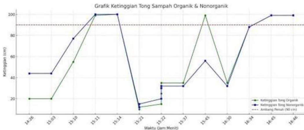
Gambar 6. Hasil Pemantauan Ketinggian Tong Sampah Organik & Nonorganik secara Real-Time

Gambar ini menampilkan hasil monitoring sistem Smart Rubbish yang telah diuji pada tanggal 20 Mei 2025. Setiap entri mencatat waktu pemantauan, ketinggian sampah dalam tong organik dan nonorganik, serta status tong berdasarkan ambang batas yang ditentukan ( \geq 90 cm dianggap penuh). Data ini dihasilkan dari pembacaan sensor ultrasonik HC-SR04 yang terhubung ke mikrokontroler ESP32 dan ditampilkan melalui antarmuka web lokal. Status "penuh" dan "belum penuh" digunakan untuk memicu notifikasi otomatis ke petugas pengelola sampah melalui Telegram.