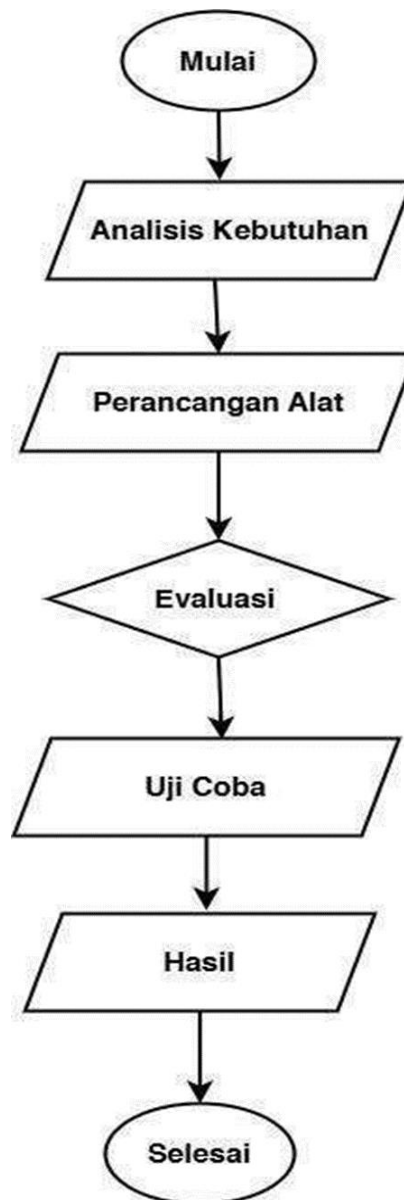
Gambar 1. Prosedur Penelitian