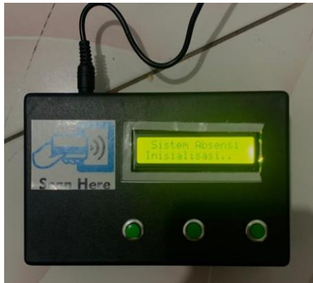
Gambar 2. Tampilan Alat

Prototype sistem perncangan system absensi kawyawan menggunakan RFID yang terintegrasi dengan mobile apps di PT SAHARA RIZKY HOLIDAYS ini dengan kartu RFID dibuat dalam bentuk rangkaian yang terdiri dari beberapa perangkat yaitu ESP32, buzzer dan sensor lcd. Rangkaian ini dihubungkan menggunakan kabel jumper dan adaptor sebagai penghubung arus. Rangkaian ini akan disambungkan ke aplikasi telegram melalui jaringan internet.