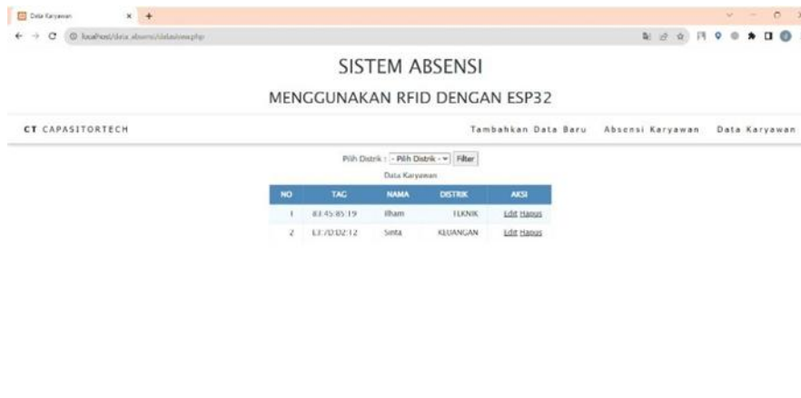
Gambar 3. Tampilan Web

Ada beberapa opsi untuk menjalankan sistem yang telah dirancang. Berikut merupakan tampilan system absensi karyawan menggunakan rfid yang terintegrasi dengan database yang telah dirancang.