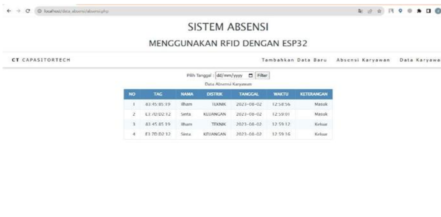
Gambar 4. Tampilan Data Karyawan