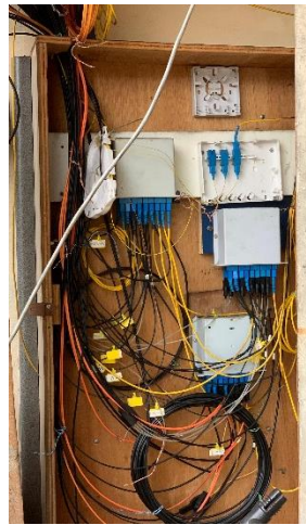
Gambar 2. Optical Distribution Cabinet (ODC)