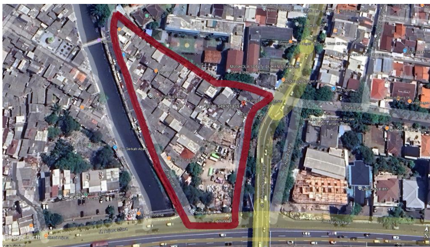
Gambar 4. Batas wilayah RT 015 Jl. Sekretaris Tanjung Duren Utara

Lokasi penelitian adalah RT 015 Jl. Sekretaris Tanjung Duren Utara, Jakarta Barat, yang dipilih karena representasinya terhadap jaringan FTTH dengan implementasi sistem ODC dan teknologi GPON . Kondisi geografis dan demografis wilayah ini menjadi dasar untuk mengevaluasi kinerja jaringan optik sesuai dengan studi serupa oleh [8].