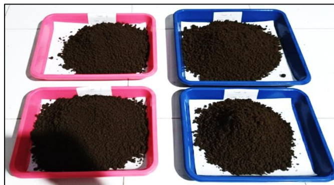
Gambar 3. Sampel tanah lahan budidaya jagung

Selain sampel tanah, dilakukan pula pengambilan dan identifikasi tanaman indigenous yang tumbuh dominan di sekitar lahan pertanian. Tanaman yang ditemukan diidentifikasi berdasarkan morfologi dan dicatat sebagai kandidat agen fitoremediasi berdasarkan tingkat dominansi dan toleransinya terhadap kondisi lahan tercemar.