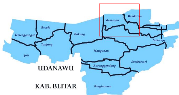
Gambar 4. Peta lokasi pengambilan sampel (Desa Slemanan, Udanawu, Kab. Blitar)

Secara umum, kondisi lahan pertanian di Desa Slemanan, Kecamatan Udanawu, Kabupaten Blitar menunjukkan bahwa praktik budidaya tanaman masih sangat bergantung pada penggunaan pestisida, baik dalam kegiatan pemeliharaan tanaman, pengendalian organisme pengganggu tanaman (OPT), maupun sanitasi lahan. Namun, dalam praktiknya, penggunaan pestisida oleh petani belum sepenuhnya menerapkan prinsip penggunaan pestisida yang tepat, khususnya konsep 6T yang meliputi ketepatan sasaran, mutu, jenis pestisida, waktu aplikasi, dosis atau konsentrasi formulasi, serta cara penggunaan.