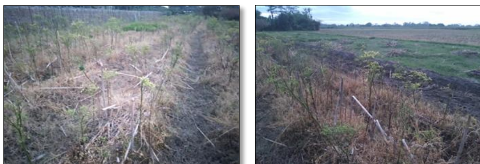
Gambar 5. Kondisi lahan bekas budidaya jagung di desa Slemanan Kec Udanawu Kab Blitar yang disemprot herbisida jenis Roundup

Kondisi tersebut menunjukkan bahwa meskipun petani telah memiliki pengetahuan dasar mengenai konsep Pengendalian Hama Terpadu (PHT), tingginya risiko kegagalan panen, pengaruh lingkungan sosial, serta kebiasaan setempat menyebabkan penerapan prinsip pengendalian hama yang tepat belum dapat dilaksanakan secara optimal. Praktik ini secara tidak langsung berkontribusi terhadap akumulasi residu pestisida di dalam tanah dan memicu degradasi lahan pertanian. Di sisi lain, tanah merupakan sumber daya utama yang sangat penting bagi keberlanjutan usaha pertanian. Pemanfaatan lahan secara intensif tanpa diimbangi dengan upaya perbaikan dan pemulihan kualitas tanah dapat menyebabkan penurunan fungsi tanah, yang ditandai dengan berkurangnya kemampuan tanah dalam mendukung produktivitas pertanian secara berkelanjutan.