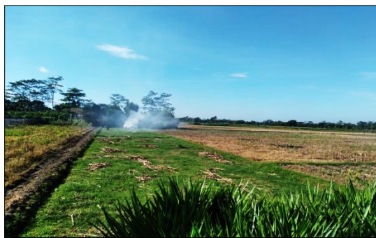
Gambar 6. Pembakaran seresah tanaman jagung pasca panen

Pemanfaatan lahan pertanian secara intensif tanpa disertai upaya perbaikan dan pemulihan kualitas tanah dapat menyebabkan degradasi tanah, yang ditandai dengan hilang atau menurunnya fungsi tanah sehingga kemampuan produktivitasnya ikut berkurang. Beberapa faktor utama yang berkontribusi terhadap degradasi dan rendahnya produktivitas tanah meliputi deforestasi, intensifikasi mekanisasi usaha tani, praktik pembakaran lahan, penggunaan bahan kimia pertanian yang berlebihan, serta sistem tanam monokultur. Kondisi lahan pertanian di Desa Slemanan saat ini menunjukkan kecenderungan penurunan produktivitas yang dipengaruhi oleh tingginya serangan organisme pengganggu tanaman (OPT) dan perubahan kondisi iklim. Situasi tersebut diduga berkaitan dengan menurunnya aktivitas mikroorganisme tanah akibat rendahnya masukan bahan organik. Praktik pertanian yang bergantung pada pupuk kimia dan pestisida secara terus-menerus, baik pada tahap pengolahan lahan, pemeliharaan tanaman, maupun pascapanen, berpotensi menurunkan kesuburan tanah dan berdampak pada produktivitas tanaman. Selain itu, praktik pembersihan lahan melalui pembakaran seresah atau sisa tanaman juga tidak dianjurkan karena dapat mempercepat kerusakan sifat fisik, kimia, dan biologi tanah.