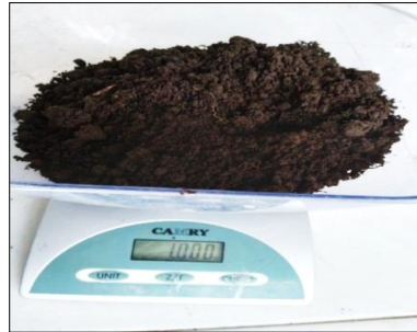
Gambar 2. penimbangan sampel tanah lahan budidaya jagung

Pengambilan sampel tanah dilakukan pada dua tipe lahan, yaitu lahan pertanian yang terpapar pestisida dan lahan pembanding yang relatif bebas pestisida. Sampel tanah diambil secara komposit dari beberapa titik pengambilan pada setiap lahan dengan kedalaman 0–20 cm menggunakan cangkul dan cetok. Sampel dari masing-masing titik dicampur hingga homogen, kemudian dikeringanginkan dan ditimbang sebanyak \pm 1 kg untuk keperluan analisis lebih lanjut.