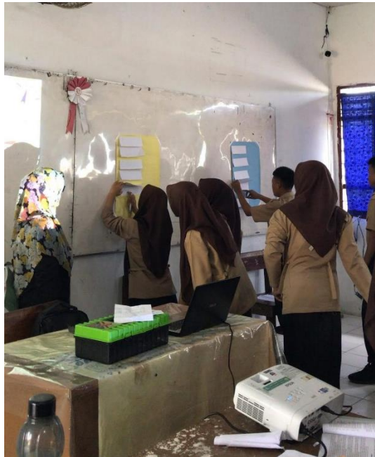
Gambar 2 Proses pembelajaran dengan menggunakan metode Team-Based Game Tournament (TGT)

Transformasi digital dalam dunia pendidikan telah mendorong guru, khususnya guru Pendidikan Pancasila dan Kewarganegaraan (PPKn), untuk cepat beradaptasi dengan berbagai perubahan. Di MAN 1 Medan, guru-guru PPKn secara aktif mengikuti pelatihan teknologi informasi dan bergabung dalam komunitas guru digital sebagai upaya meningkatkan kompetensi. Mereka menguasai berbagai aplikasi seperti Canva dan Google Classroom, yang digunakan untuk menciptakan pembelajaran yang interaktif dan menarik sesuai dengan karakteristik generasi Z. Hal ini menunjukkan pergeseran peran guru dari penyampai informasi menjadi fasilitator pembelajaran digital yang kreatif dan kontekstual (Montessori et al., 2022). Selain itu, strategi pembelajaran aktif dan berbasis proyek diintegrasikan dalam proses pembelajaran. Misalnya, siswa membuat vlog bertema Pancasila, poster digital bertema toleransi, serta presentasi isu sosial. Strategi ini terbukti meningkatkan antusiasme dan partisipasi siswa dalam memahami nilai-nilai PPKn karena siswa terlibat langsung sebagai subjek pembelajar (Gustifal et al., 2024; Dewi & Jatiningih, 2015). Kegiatan ini membuat pembelajaran menjadi lebih hidup dan relevan dengan kehidupan nyata siswa.