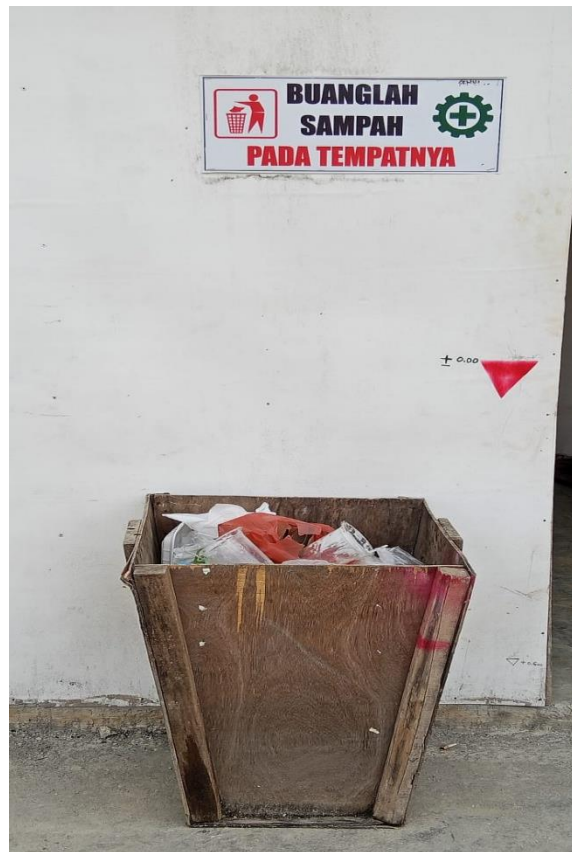
Gambar 5. Contoh pemilahan dan pemanfaatan kembali limbah konstruksi