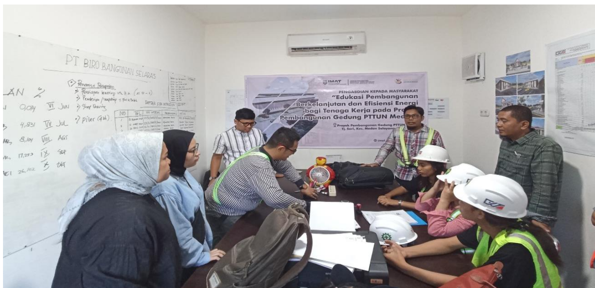
Gambar 1. Sesi edukasi dan penyampaian materi kepada tenaga kerja proyek.