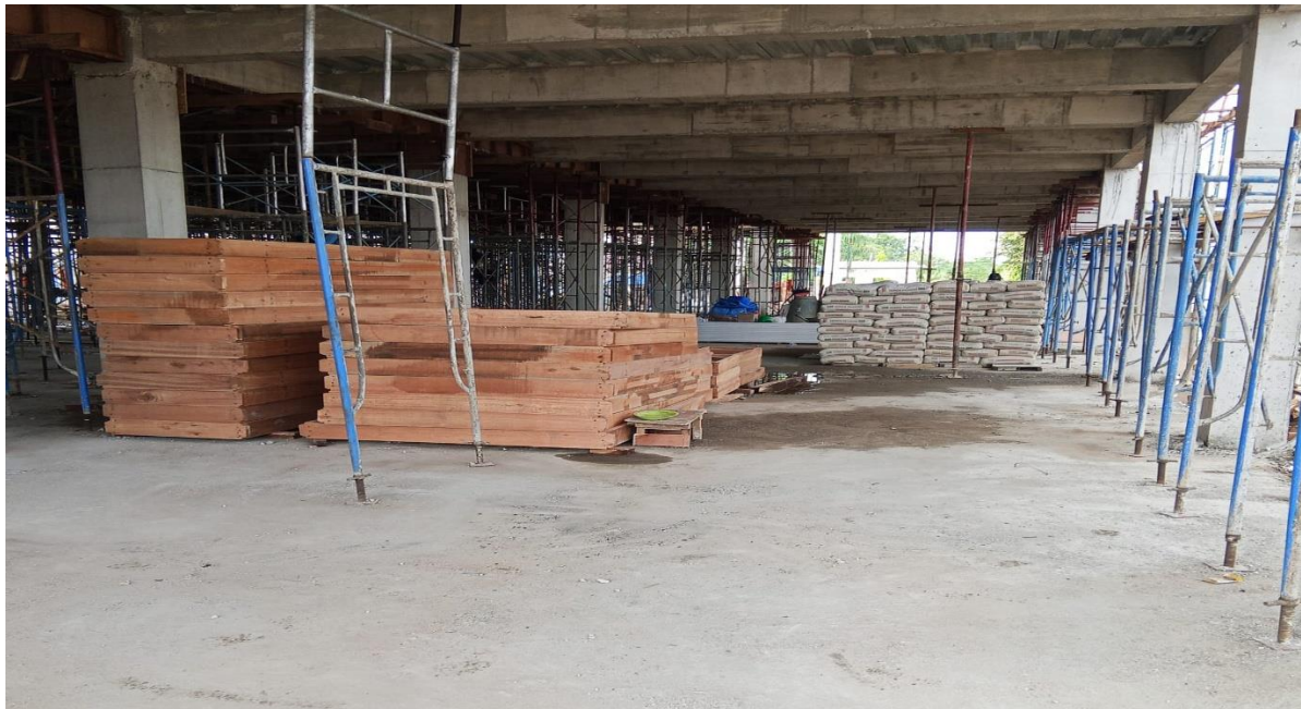
Gambar 7. Kondisi lingkungan kerja yang lebih tertib dan aman setelah edukasi.

Temuan ini memperlihatkan bahwa pendekatan edukatif berbasis praktik langsung sangat efektif dalam meningkatkan kualitas proyek konstruksi, terutama dalam aspek keberlanjutan ( sustainability ), keselamatan ( safety ), dan efisiensi ( efficiency ). Praktik pencatatan volume beton sebelum pengecoran mencerminkan adopsi prinsip lean construction , yang menurut Aziz dan Hafez (2013), dapat menekan pemborosan material sebesar 20–25% pada proyek skala menengah. Hal ini menegaskan bahwa intervensi edukatif mampu menghasilkan efisiensi secara kuantitatif.