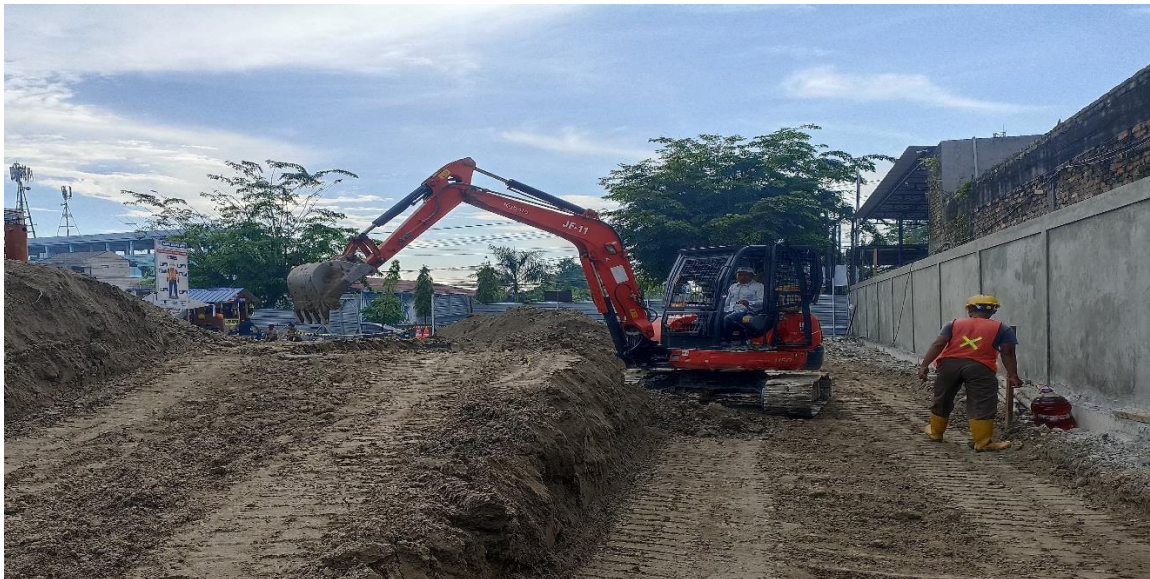
Gambar 4. Penggunaan alat berat yang efisien di lokasi proyek