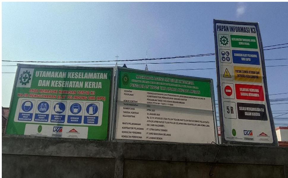
Gambar 2. Contoh media visual edukasi yang terpasang di area proyek.