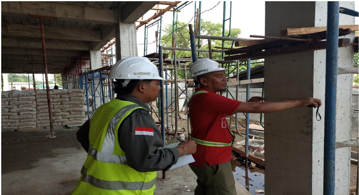
Gambar 3. Implementasi pencatatan volume beton untuk efisiensi material