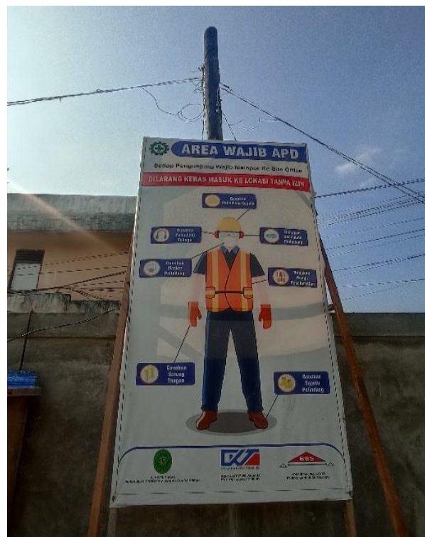
Gambar 6. Pemasangan papan SOP di area kerja proyek.