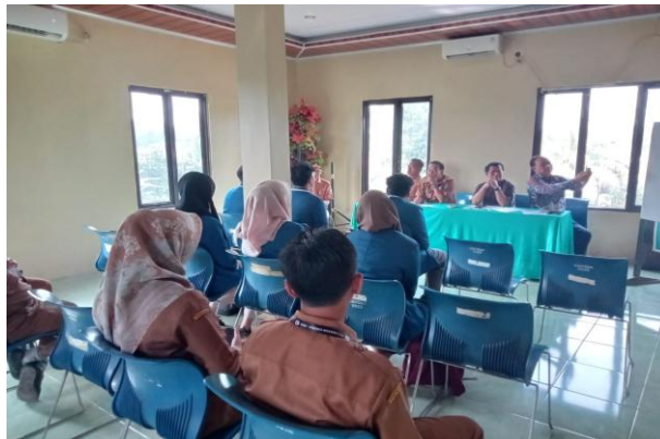
Gambar 1. Diskusi Awal dengan Perangkat Desa dalam Identifikasi Permasalahan SISKEUDES (Dokumentasi laporan: forum diskusi tim pengabdian dan perangkat desa di balai desa).

Temuan-temuan pada tahap observasi ini kemudian dicatat dan dirumuskan dalam bentuk daftar permasalahan sebagai dasar penyusunan strategi pendampingan pada tahap berikutnya. Dengan demikian, tahap observasi dan identifikasi masalah tidak hanya berfungsi sebagai pengumpulan data awal, tetapi juga menjadi fondasi penting untuk memastikan bahwa kegiatan asistensi yang dilakukan benar-benar relevan dengan kebutuhan dan kondisi riil Desa Cibugel.