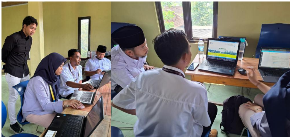
Gambar 3. Praktik Input Transaksi Keuangan Desa di Aplikasi SISKEUDES (Dokumentasi laporan: perangkat desa didampingi tim pengmas melakukan simulasi aplikasi)

Penerapan metode learning by doing membuat perangkat desa lebih cepat memahami proses pengelolaan keuangan berbasis SISKEUDES, sekaligus meningkatkan kepercayaan diri dalam mengoperasikan aplikasi secara mandiri. Melalui praktik langsung ini, perangkat desa mulai terbiasa dengan ritme pencatatan transaksi dan penyusunan laporan secara periodik, yang menjadi fondasi penting bagi tertib administrasi keuangan desa.