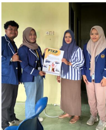
Gambar 4. Serah Terima Modul Panduan SISKEUDES Kepada Perangkat Desa (Dokumentasi laporan: penyerahan modul oleh tim pengmas kepada perangkat desa).

Analisis gap dilakukan dengan membandingkan kondisi awal, intervensi, dan hasil. Hasilnya terangkum pada Tabel 2.