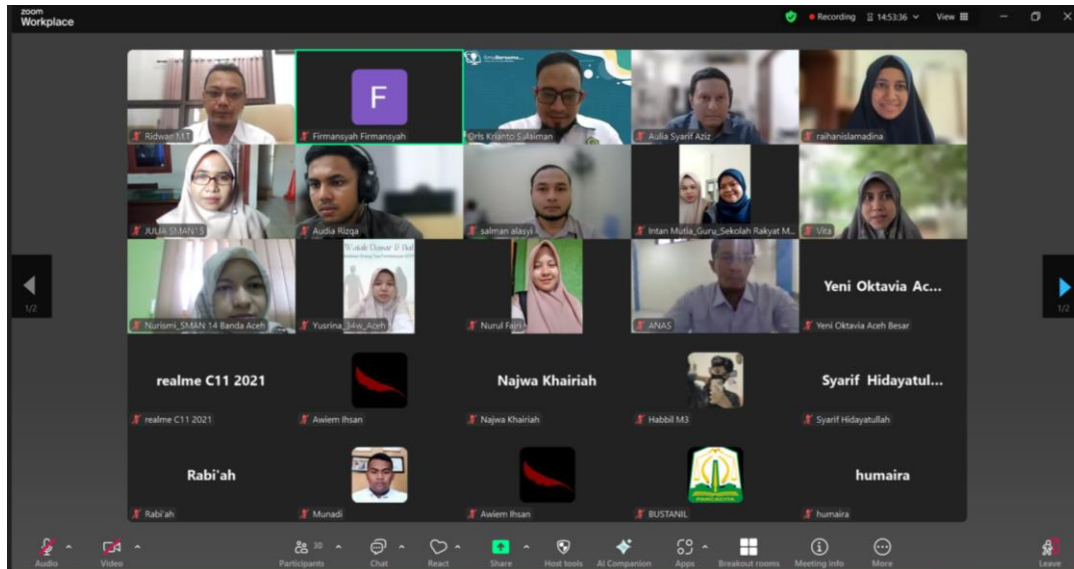
Lampiran 1. Foto Bersama Peserta