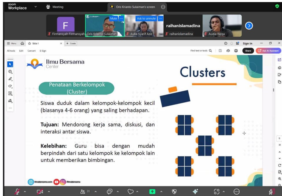
Gambar 3. Pemaparan Materi Penataan Laboratorium Komputer

Materi ketiga membahas aspek teknis tata kelola ruang yang sering menjadi keluhan utama peserta, yaitu persoalan kabel yang tidak teratur (spaghetti cables). Materi ini membedah teknik manajemen kabel (cable management) yang rapi dan aman.