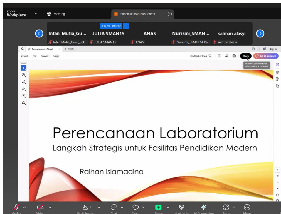
Gambar 2. Pemaparan Materi Perencanaan Laboratorium Komputer

Pada sesi kedua, pembahasan beralih ke aspek manajerial, yaitu perencanaan. Narasumber menyoroti kesalahan umum yang sering terjadi di sekolah, yakni ketidaktepatan dalam pengadaan perangkat. Hal ini sering kali berujung pada spesifikasi perangkat yang terlalu rendah (under-spec) atau justru terlalu tinggi (over-spec) yang memboroskan anggaran sekolah.