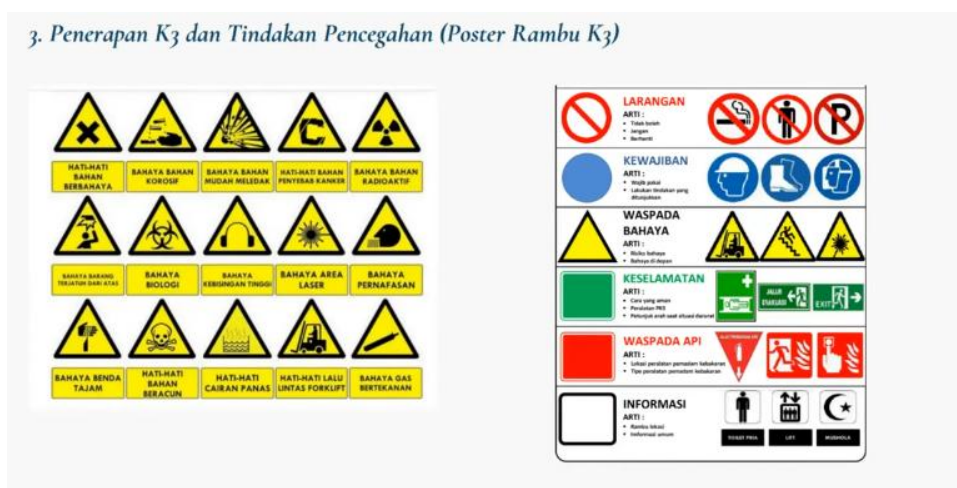
Gambar 4. Pemaparan Materi K3: Kesehatan dan Keselamatan Kerja

Materi penutup pada sesi pemaparan adalah implementasi Kesehatan dan Keselamatan Kerja (K3). Aspek ini sering kali terabaikan di lingkungan sekolah. Narasumber memberikan edukasi mengenai standar instalasi kelistrikan yang aman, termasuk urgensi sistem pembumian (grounding) untuk mencegah risiko korsleting dan kerusakan perangkat akibat listrik statis.