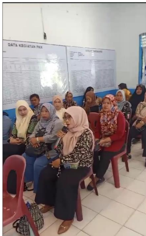
Gambar 4. Sesi Diskusi dengan Pelaku UMKM Kecamatan Sunggal