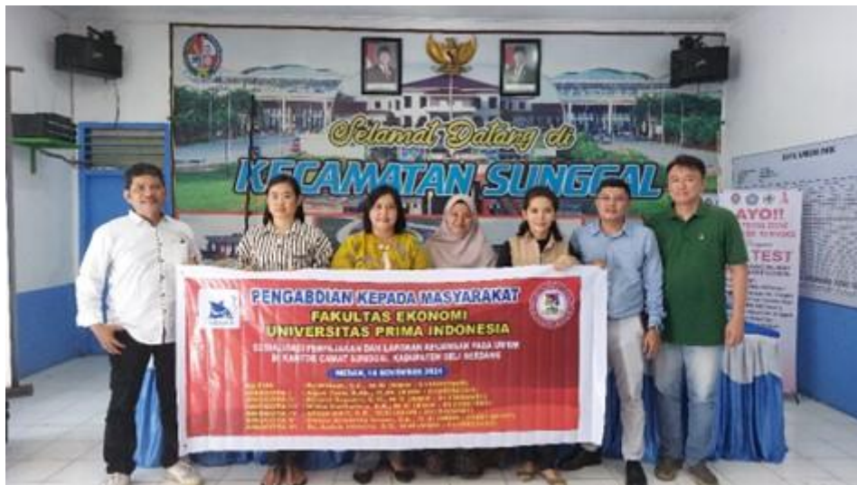
Gambar 1. Tim Pengabdian Kepada Masyarakat