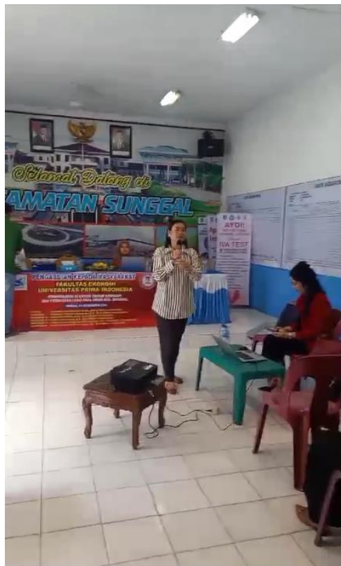
Gambar 3. Sosialisasi Perpajakan dan Pembukuan kepada para Pelaku UMKM Kecamatan Sunggal