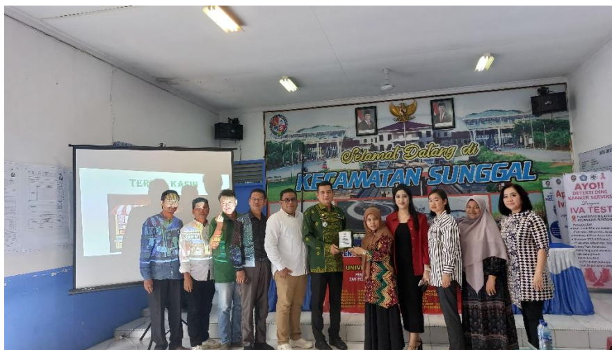
Gambar 2. Penyerahan Plakat Kepada Pimpinan Kantor Camat Sunggal